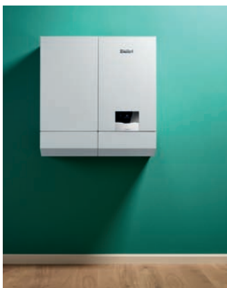
ecoTEC plus με ταμειυτήρα uniSTOR

Ο νέος επίπεδος σχεδιασμός και η ευκολία στον χειρισμό λειτουργίας του ecoTEC plus μέσω την νέας οθόνης αφής, καθιστούν την εγκατάσταση και τη λειτουργία του λέβητα ιδιαίτερα απλή. Η καθαρή δομή του μενού, ο επεξηγητικός βοηθός εγκατάστασης και το κείμενο στα ελληνικά διευκολύνουν την πλοήγηση.