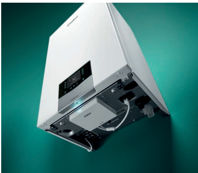
ecoTEC plus με sensoNET

Ο ecoTEC plus είναι εξοπλισμένος με έναν σύγχρονο κυκλοφορητή υψηλής απόδοσης, και διαθέτοντας LIN bus επικοινωνία, παρέχει ένα βαθύτερο επίπεδο πληροφοριών στο νέο μενού της συσκευής. Θα λάβετε ακριβή δεδομένα της ηλεκτρικής κατανάλωσης του κυκλοφορητή και λεπτομερή διάγνωση για αποτελεσματικότερη λήψη ενημερώσεων ενδεχόμενων βλαβών.