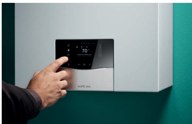
Ευκολία στον χειρισμό μέσω της οθόνης αφής