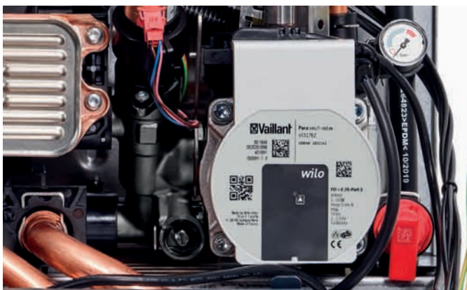
Ο νέος κυκλοφορητής υψηλής απόδοσης

Ο πυρήνας του νέου ecoTEC plus είναι ο έλεγχος καύσης μέσω της βαλβίδας αερίου IoniDetect. Αυτό το σύστημα καύσης ανιχνεύει αυτόματα τύπους αερίου και πετυχαίνει τον βέλτιστο λόγο αέρα καύσης. Το νέο ενσωματωμένο ηλεκτρόδιο ελέγχου ιονισμού εποπτεύει συνεχώς την φλόγα. Αυτό επιτρέπει τη βέλτιστη ποιότητα καύσης προσαρμόζοντας την αναλογία αερίου - αέρα. Κατ' αυτόν τον τρόπο θα είστε πλήρως προετοιμασμένοι για οποιαδήποτε αλλαγή του τύπου αερίου απαιτηθεί τα επόμενα χρόνια.