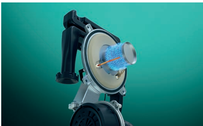
Βαλβίδα αερίου IoniDetect

Ο νέος ecoTEC plus: Ο ευέλικτος λέβητας για κάθε σπίτι με την πιο σύγχρονη και δοκιμασμένη τεχνολογία.