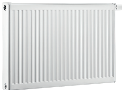
Logatrend C-Profil Logatrend VC-Profil