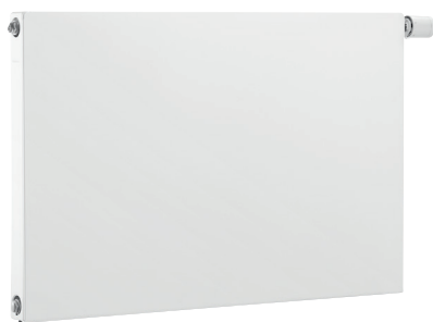
Logatrend C-Plan Logatrend VC-Plan